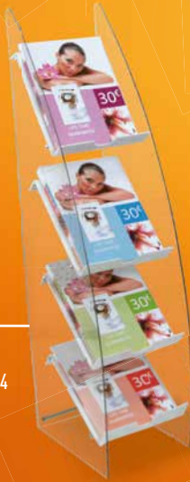
E Présentoir de catalogues A4 4 niveaux