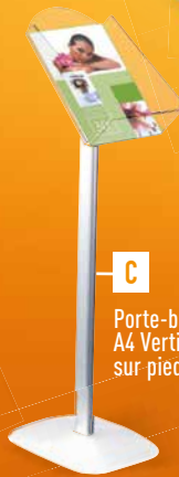
C Porte-brochures A4 Vertical sur pied