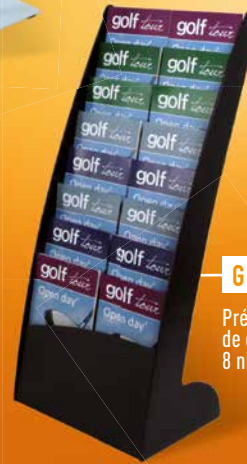
G Présentoir de catalogues 8 niveaux