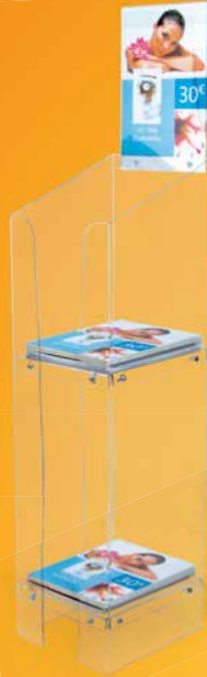
D Présentoir de catalogues A4 2 niveaux sur pied