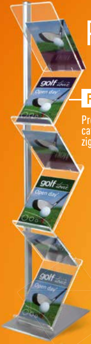
F Présentoir de catalogues A4 zig-zag